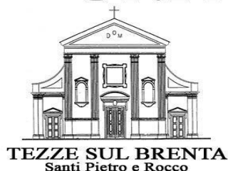
TEZZE SUL BRENTA Santi Pietro e Rocco