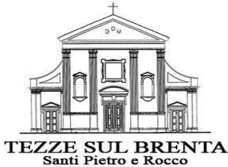
TEZZE SUL BRENTA Santi Pietro e Rocco