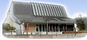
STROPPARI Beata Vergine Maria Madonna della Salute