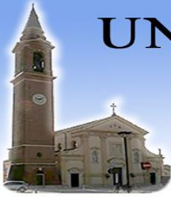
TEZZE SUL BRENTA Santi Pietro e Rocco