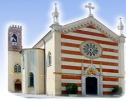
BELVEDERE Sacro Cuore di Gesù