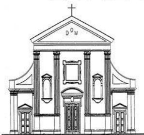
TEZZE SUL BRENTA Santi Pietro e Rocco