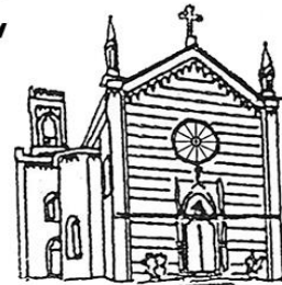
BELVEDERE Sacro Cuore di Gesù