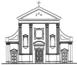
TEZZE SUL BRENTA Santi Pietro e Rocco