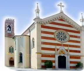
BELVEDERE Sacro Cuore di Gesù