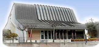
STROPPARI Beata Vergine Maria Madonna della Salute