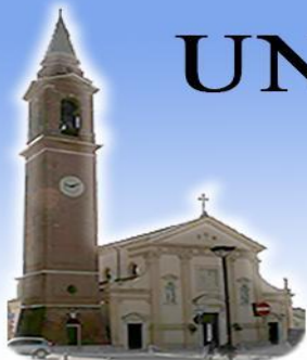
TEZZE SUL BRENTA Santi Pietro e Rocco