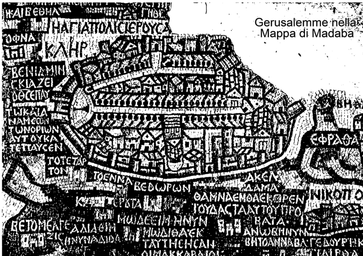
Gerusalemme nella -Mappa di Madaba