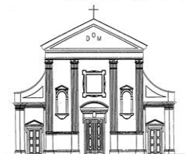
TEZZE SUL BRENTA Santi Pietro e Rocco